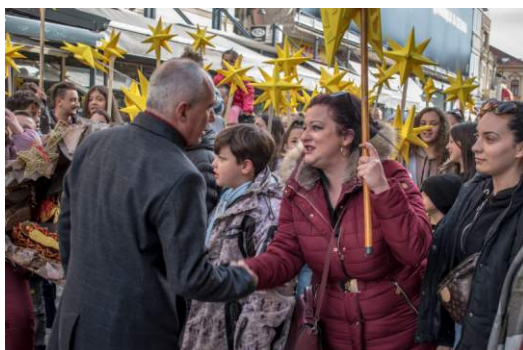
Бадникови поворки – хуманост и подадена рака за секого