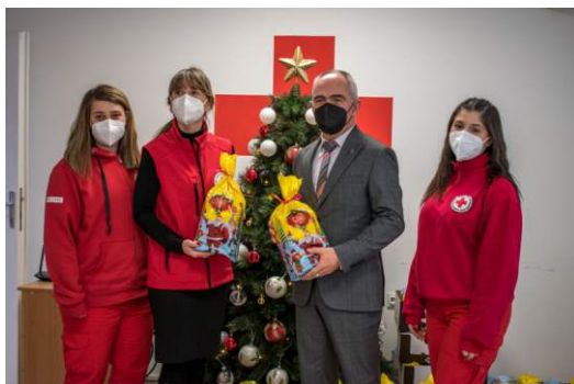
Новогодишните пакетчиња за деца со ретки болести и деца од социјално ранливи семејства