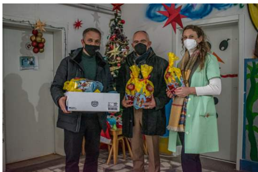
Новогодишни пакетчиња на децата од Центарот за поддршка на учењето на деца со попреченост во ОУ „Горѓи Сугарев“