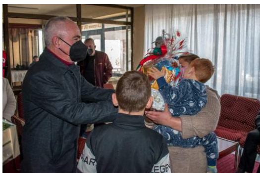
Божиќна радост и за бездомните лица