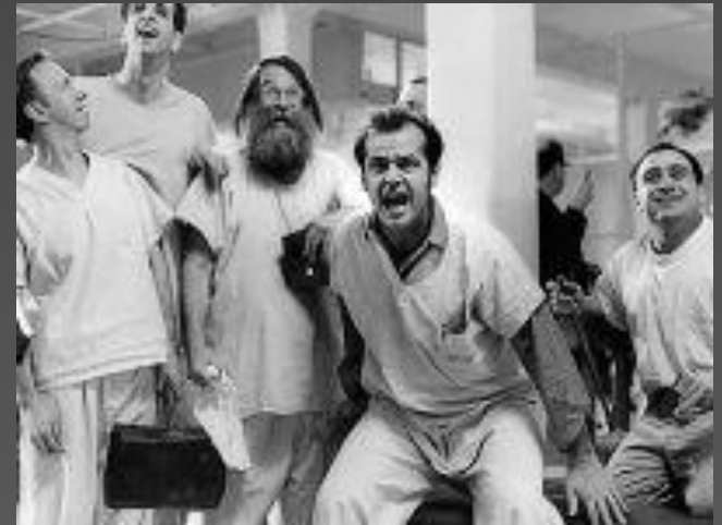
Сцена од филмот “One Flew Over the Cuckoo's Nest” (1975)