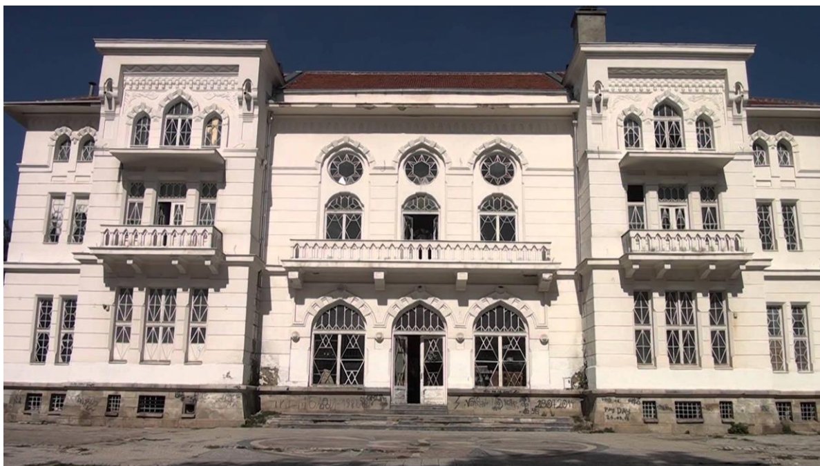
Слика 1 Сегашна состојба на Офицерскиот дом во Битола