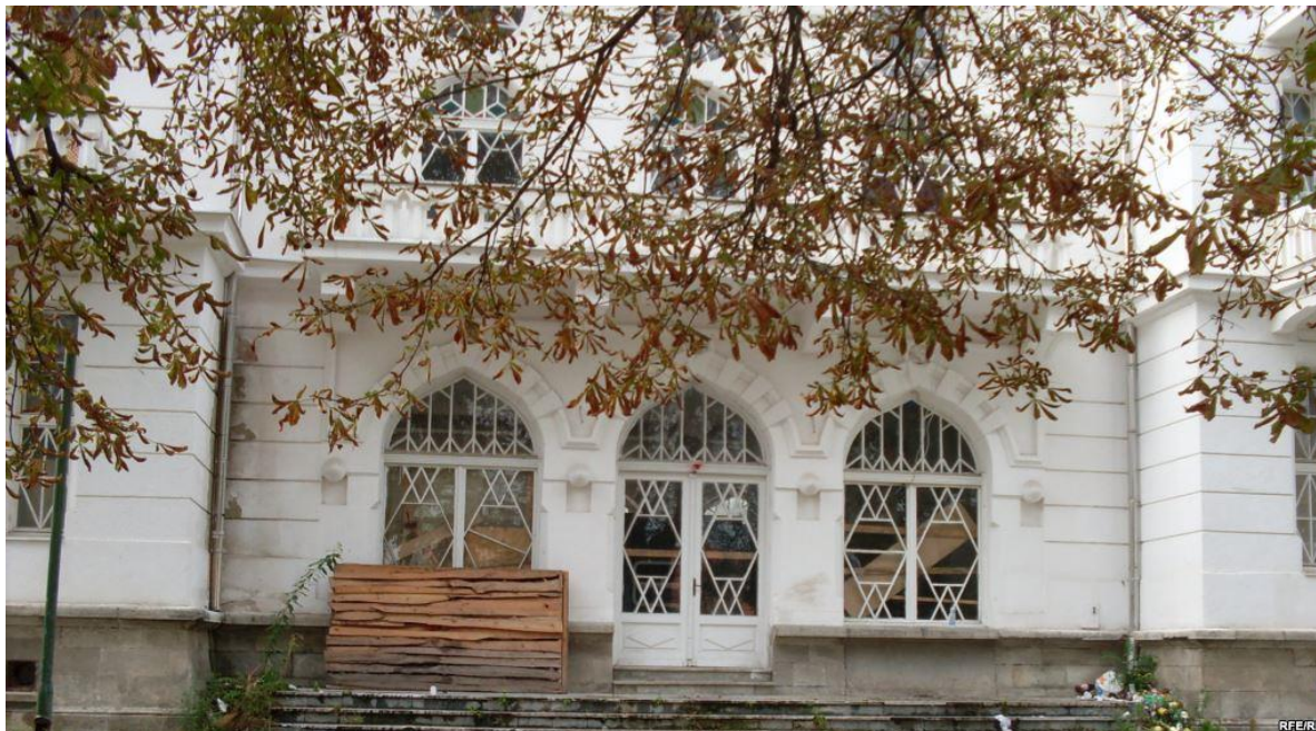
Слика 2 Сегашна состојба на влезот на Офицерскиот дом во Битола

Поради сегашната состојба на објектот кој е во деградирана состојба Општина Битола предвидува негова комплетна реставрација и адаптација. Притоа се предвидува демонтажа на основните градежни материјали (керамиди, дел од дрвената покривна конструкција, малтер).