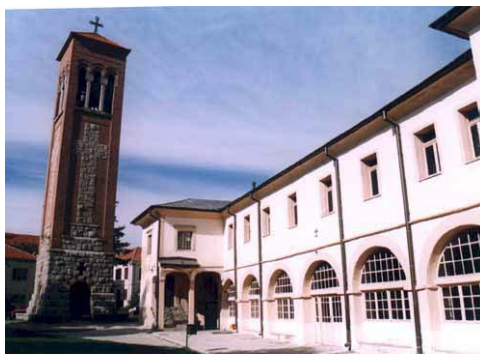
Црквата "Св. Димитрија"

Црква "Пресвета Богородица". Таа е уште еден од познатите битолски црковни храмови, изградена во 1870, а осветена во 1876 год. Црквата претставува трибродна базилика во поскрмна форма. Во архитектонска смисла храмот нема некои особени посебности, бидејќи на него можат да се забележат повеќе стилови, карактеристична одлика на тогашниот еклектика, по која е видена кај вакви објекти од минатиот век: траги од неокласицизам, барок, романтизам и сл. Овој храм е познат со својот иконостас и резба што можат да се видат на олтарот. Се смета дека го работеле мијачките мајстори. Во храмот можат да се видат повеќе убави икони од XIX и XX век на различни дарители. Најмногу дарувале битолските еснафи.