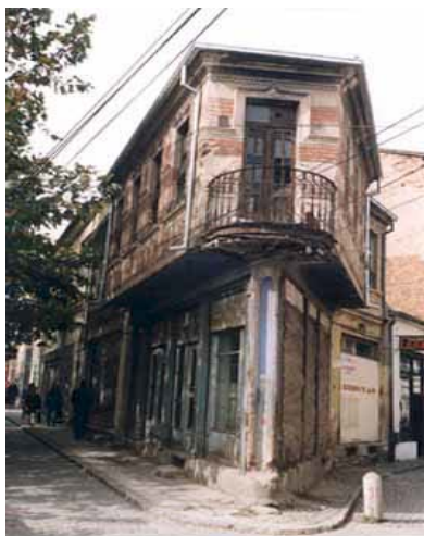
Градби од Старијата чаршија

ориенталниот урбанизам и градителство, таа останува неповторлив пример на битолското културно наследство. Во својот речиси петвековен развој, во најголемиот свој процут (особено во текот на XIX век), имала над 2.000 дукани и 30 функционално поделени делови, определени според стоката што се продавала. Во времето на Првата Светска Војна на Битолската чаршија и е зададен најтешкиот удар којшто никогаш повеќе не ја поврати некогашната слава и економска моќ.