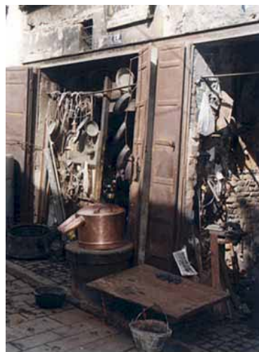
Последните занаети во чаршијата

Хераклеа Линкестис – Античкиот град Хераклеа Линкестис крај Битола, е културна ризница на Балканот. Некогаш градот со истоименото име се наоѓал на падините на Баба крај Сива вода. Се претпоставува дека градот го основал древномакедонскиот владетел Филип II во 349 год. п.н.е. Не е исклучена можноста дека на тоа место некогаш постоела илирска населба зашто според името таа можела да биде формирана само од древно - македонските владетели.